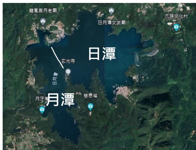
圖 3 日潭與月潭衛星影像圖（由 Google Earth 截圖並加繪，2023年2月9日）

除了美得令人屏息的景色，日月潭蘊藏的原住民文化以及自然生態亦是珍貴的資源。居住於日月潭的原住民族以邵族及布農族為主，有令人垂涎的特色佳餚、迷人的傳說故事、宛若天籟的傳統歌曲與充滿活力的舞蹈，而各種歲時祭儀更是別具一格。日月潭的環潭自行車道曾被美國有線電視新聞網（CNN）評為全球十大最美自行車道，在其上騎乘自行車時，能一面眺望波光粼粼的碧潭，感受潭的壯闊，一面欣賞種類多樣的葳蕤草木，其中隨季節變換顏色的成排落羽松，使四時之景有所不同，宛如置身奇幻仙境，而樂亦無窮也。山重水複的日月潭氣候溫暖潮濕，是極為優良的動物棲地，饒富爬蟲類及兩棲類，夜間時能聽見蛙類抑揚頓挫的合唱，而棲息在日月潭的鳥類包含在地的留鳥以及過度的候鳥，經常能瞥見鳥類覓食或自在飛翔。豐富的生態中，昆蟲也從不缺席，不僅有大量甲蟲，被譽為「蝴蝶鎮」的日月潭及埔里地區更有超過150種蝴蝶，可謂賞蝶聖地。