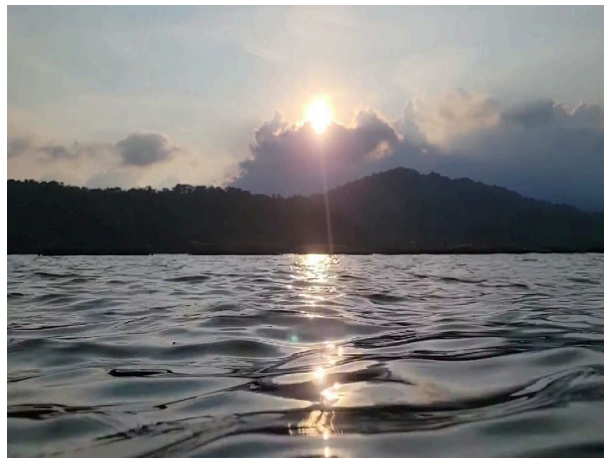
圖 1 日月潭（2022年）

日月潭是我自幼便時常造訪的觀光勝地，有別於其他景點，不論去過多少次，從不令我感到乏味。猶記得在我童稚時，對於日月潭的印象僅有藍綠色的廣袤潭水以及周圍的美食如紅茶餅與「阿嬤e古早味香菇茶葉蛋」，尤其茶葉蛋的香氣與口感更是深刻的印在我的心版上；而今，雖然親切的金盆阿嬤已然與世長辭，碧綠的潭水卻仍閃爍著波光，不禁令我感慨物是人非，我仔細端詳著粼粼水波，腦中浮現了蘇軾的《赤壁賦》，同時我心裡也漾起波瀾，便摸出手機以鏡頭攫住這美如幻境的瞬間（見圖1），開啟對日月潭更深入的探索。